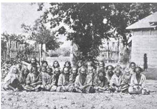
開拓使によって札幌郡対雁村に強制移住させられた樺太アイヌの人々 (北海道大学附属図書館所蔵)