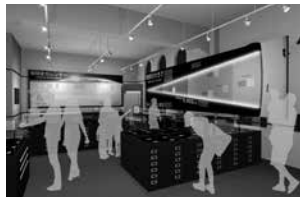
展示室のイメージ

北海道大学総合博物館に収蔵された約40万点もの鉱物や岩石、鉱石標本の一部を公開する「鉱物・岩石標本の世界」展示室が8月4日にオープンします。博物館の耐震改修工事のために解体された旧展示室に替わる展示では、「地球を感じる展示」として「6.4m(100万分の1スケール)の地球断面図」と「4.6mの地球史カレンダー」を設置。クラウドファンディングの支援で制作された迫力あるパネルと、地球環境を反映した鉱物・岩石から、日常スケールでは想像しにくい地球の悠遠な時空間を体感できます。