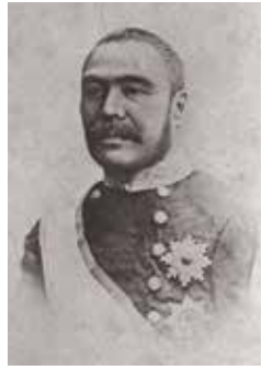
開拓長官時代の黒田清隆