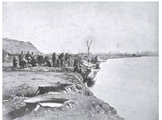
石狩川宇シビシビウス(樺太アイヌの人々に割り当てられた鮭漁場の一つ)での鮭漁業

「アツシ判官」の願い空しく 強行された内陸への移住は、 海の民・樺太アイヌの人々に 多くの苦しみを生んだ。