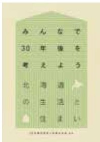
30年後の住まいを考える会 (発売元:中西出版) A5判、119頁 2014年12月刊行

30年後には2/3とも言われる急激な人口減少が予測される北海道。快適な冬の暮らしを追求し、「北方型住宅」を得た北国の住まいは、この大きな変化をどう乗り切ればよいのでしょうか。 この問題に対し、道内の建築専門家たちが人口や住まいの傾向を分析。全国の事例を研究しながら、30年後の豊かで「持続可能な」生活と住まいの実現に向けて必要な変化を、一目で分かるビジュアルで提案します。