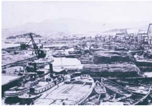
完成当時の小樽運河。写真奥では工事が続いている

河を造る工事が始まった。 意外に知られていないのが、小樽運河の 工法だ。運河といえは普通、陸地を掘って 水路をつくるのが一般的だが、小樽運河の