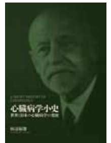
田辺福徳(自費出版) A5判、256頁(予定) ※入手ご希望の方は中西出版までお問い合わせください。

心臓病学の発展史を記した成書は欧米では多く見られますが、日本での出版はごく僅かに留まっています。本書は心臓病学の古典的名著や文献などの貴重な資料を原書から紐解き、黎明から20世紀に至る流れを概説。学問成立の過程が分かりやすく書かれています。 進歩に貢献した医学者たちの人となりにも多く触れ、個人的なエピソードは読み物としても楽しめる充実した内容となっています。