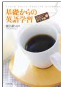
中西出版 A5判、314頁 2014年11月刊行

好評を博した英文法の学習書「基礎からの英語学習」が、パワーアップした改訂版になりました! 毎日無理なく続けるために、1日の学習量を設定。90回のレッスンでは、図や用例のほか、理解を深めるための参考事項を豊富に用意し、レッスンの確認ができる簡単な確認問題のURLアドレスも掲載中です。 改訂版では33の豆知識が追加され、さらに充実した入門書となっています。