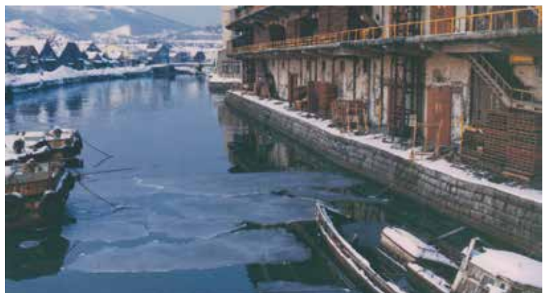
昭和40年代頃。廃屋となった倉庫と錆びついた船

運河創設時と同様、長期戦になるかと思 われた昭和五十八（一九八三）年、市側が 埋め立て工事に着手。六十一年に道道小樽