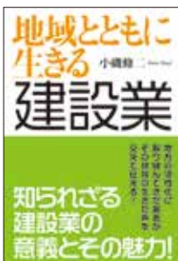
中西出版 四六判、252頁 2014年8月刊行

風土に根ざしたその実際を、地域政策を領域とする研究者が取材。「地域自身がどのように活気ある社会を作っていくのか」を見つめる視点での提言からは、地域の情報に精通し、運命共同体として発展の鍵を握る「地域産業としての建設業」の新たな姿が見えてきます。