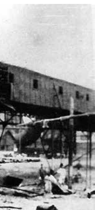
艦砲射撃の被害 日本製鐵株式会社