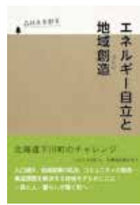
下川町(発売元:中西出版) A5判、80頁 2014年8月刊行

「木質バイオマス」でのエネルギー自立と集住化、森林総合産業の創造による雇用の創出など、町内の「一の橋地区」地域復興プランにスポットを当て、循環型の地域モデルを示します。