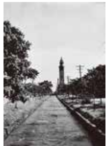
創成河畔 1935年頃 「札幌市写真帖」より 中西寫真製版所

明治初期の田本研造「開拓写真」に始まり、人々の暮らしを撮り続けた掛川源一郎、北海道を空からとらえた清水武男、篠山紀信などの幅広い層の作品を紹介。歴史の中でこの土地がどう変わり、また変わらずにきたのかを、写真に切り取られた場面の中から探ります。