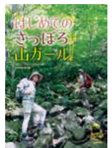
北海道新聞社 A5判、160頁 2014年5月刊行

季節ごとのファッションはもちろん、必要な持ち物選びのポイント、山登りのマナーやルールなど「山の基本」を丁寧に解説。21山を紹介した難易度別登山ガイドでは、ルートや高低図、所要時間が一目で分かる図に加え、周辺の立ち寄りスポットも掲載しています。