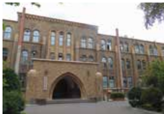
1929年に理学部本館として竣工した博物館。風格ある建物はそれだけで一見の価値がある

企画展では開催を記念し、同名の書籍を一般発売。洋上のキャンパスの実際を誌面でもお楽しみいただけます。