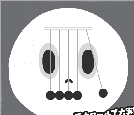
巨大マ〜ルで大実験